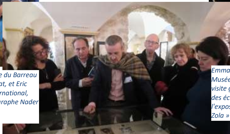
Visite de l'exposition « L'Affaire : de Dreyfus à Zola » du Musée du Barreau de Paris avec les membres du PEN International