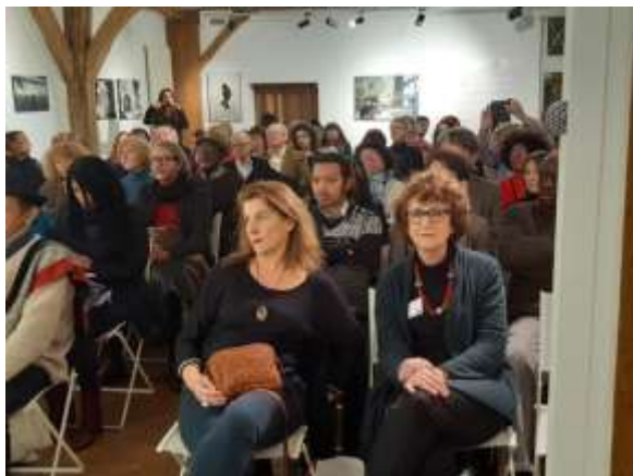
Soirée littéraire "La voix des femmes en Afrique"