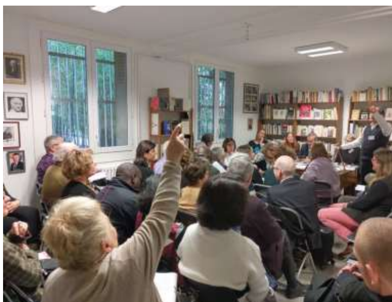
Les délégués internationaux des centres PEN à la première session du Comité des écrivains pour la Paix présidé par Emmanuel Pierrat

Les 50 délégués internationaux présents se sont réunis dans les locaux du PEN Club français, le 21 janvier lors de la première séance du Comité pour rappeler de ce qui avait été fait à Manille en septembre 2019 et réaffirmer l'importance des résolutions précédemment adoptées comme la résolution sur les menaces contre la démocratie, la résolution sur les menaces contre la liberté d'expression et la Paix en Asie du Sud-Est ou encore la résolution sur l'émigration et les écrivains en exil. Cette première