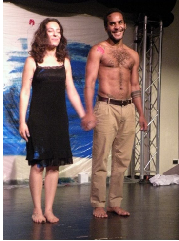
Comédiens du Collectif La Fabrique