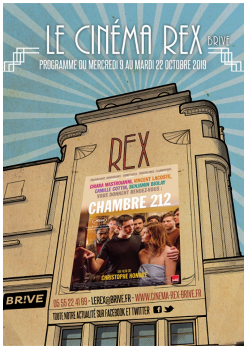
Couverture du dépliant du Cinéma REX qui accueille l'événement – PEN Club partenaire